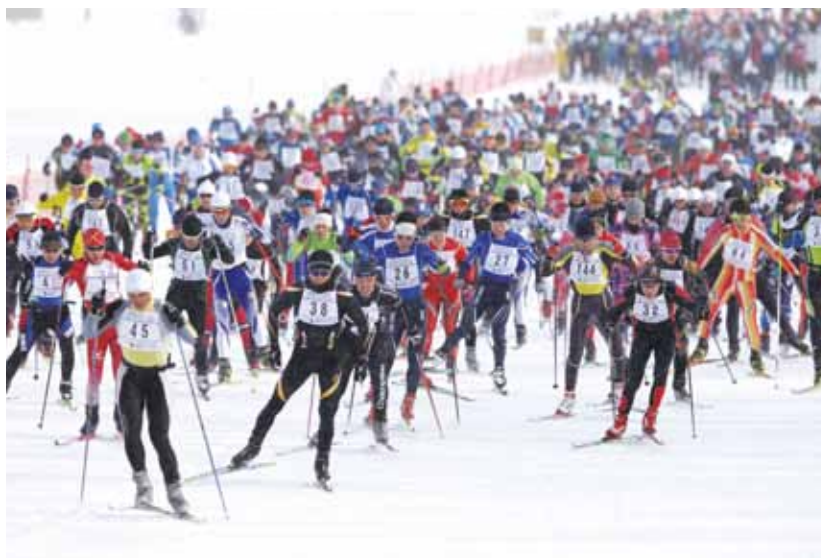
スキーマラソン50kmスタート風景

国民の健康増進及びスポーツの普及振興を図るため、第33回札幌国際スキーマラソン大会を開催。国内31都道府県及び海外20か国119名の申込を含む2,054名が参加しました。