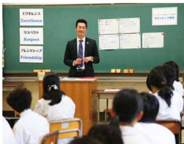
宮下純一先生(競泳)による「座学の時間」

※紹介事業は一例です。その他の事例を含め詳しい情報は、 RING!RING!プロジェクトホームページに掲載しております。ぜひご覧ください。