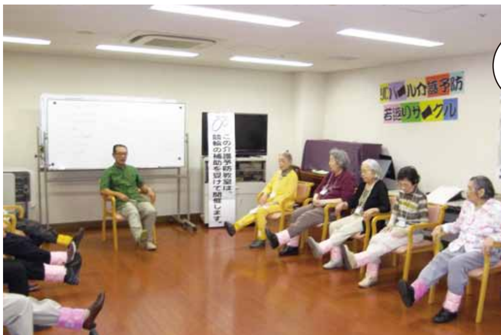
筋力強化体操風景

理 学療法士の指導による転倒・骨折予防筋力トレーニング、管理栄養士による栄養・食事に関する情報提供を行いました。