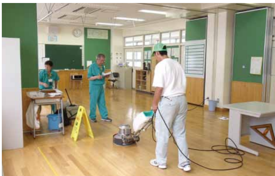
清掃技能の指導研修風景

都 立特別支援学校などを巡回し、清掃の仕方、設備の取り扱い方などの指導研修を行い、障害のある児童・生徒の清掃技能の向上を図りました。