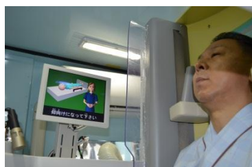
側面ビデオモニター