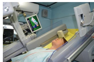
モニター付透視台