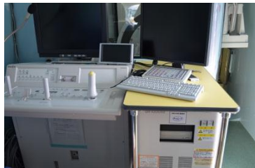
撮影とモニター操作機